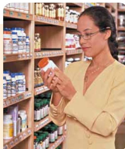
2 Les etiquetes dels productes ens informen sobre les seues característiques.

Els consumidors disposem d'una sèrie de drets . Per exemple, tenim dret a ser informats sobre les característiques del producte 2 , a adquirir productes segurs o a ser compensats si comprem un producte que presenta algun defecte. Per aquesta raó, hi ha associacions que defensen els drets dels consumidors.