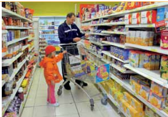
1 El consum permet adquirir els productes que necessitem.

Si les persones no compràrem nous productes, no hi hauria empreses dedicades a produir-los. Per això, els consumidors som importants en el món de les empreses.